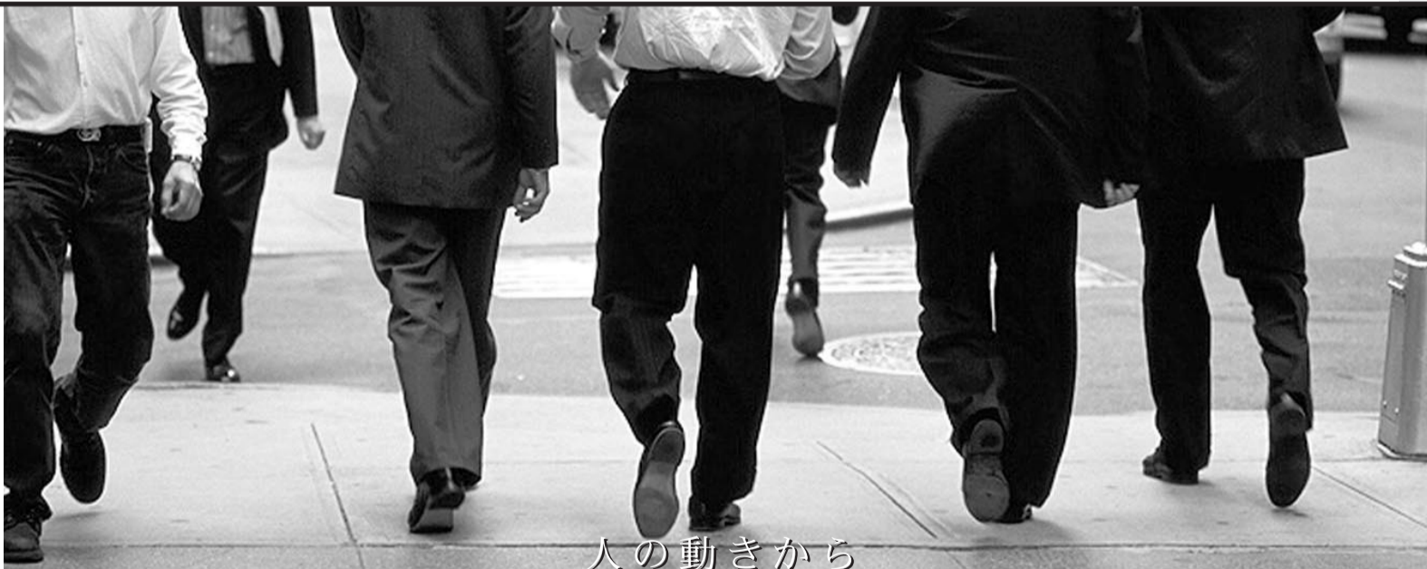
人の動きから経営が見える

企業は人で動きます。人をいかに配置するかは、その会社の経営戦略そのものです。取引先のキーパーソンの動きを、組織改革や他のキーパーソンの動きと結び付けて自分なりに分析してみてください。無味乾燥な情報の裏側にある真実が見えてくるはず。 「会社人事欄を読み込む」。それが“次”への第一歩です。